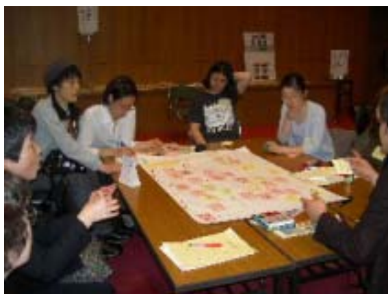
グループEのテーブル

グループEでは、まちのバリアフリーをソフトバリアフリーとハードバリアに分類して、さらにそれぞれ参加者の体験から掲げたキーワードについて話し合った。特に聴覚に障がいのある人の具体的で貴重な意見があった。