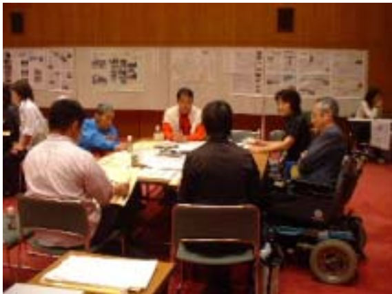
グループAのテーブル