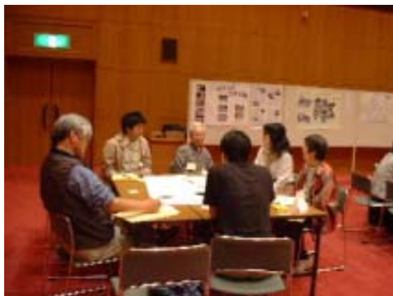
グループCのテーブル

グループCでは、制度・システム、ソフト(人)、ハード(都市施設の現状)というテーマに分けて話し合い、多様な意見を通して「制度やシステムとハードをつなぐのは人」というメッセージとしてまとめている。